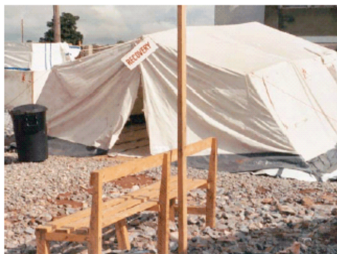
FIGURA. Tiendas de tratamiento y recuperación en el Centro de tratamiento de cólera en Chawama, donde más de 100 pacientes al día fueron atendidos al tope de la epidemia – Lusaka, Zambia, 2004

Usted es un epidemiólogo de campo que es llamado para entrevistar a miembros de la comunidad procedentes de los vecindarios donde se han originado varios casos. La investigación está en proceso de realizarse y los resultados todavía no se conocen.